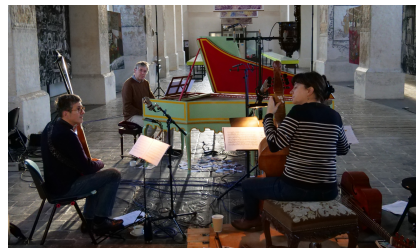
Béguinage de Saint-Trond (Belgique), novembre 2022 Enregistrement du disque Marais