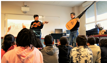
Ecole Kergomard (45), 13 décembre 2022 Intervention en classe autour du Carnaval des animaux en péril dans le cadre de Cités Educatives