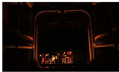
Théâtre de Lisieux, 8 décembre 2022 L'Autre Monde ou les Etats et empires de la Lune