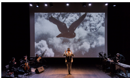
Philharmonie de Paris, 16 novembre 2022 création du Carnaval des animaux en péril