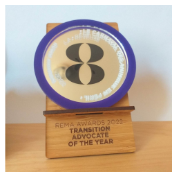
Dublin, 25 novembre 2022 Remise du REMA Award Transition advocate of the year