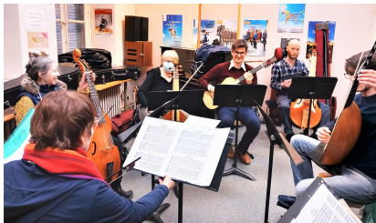
Conservatoire d'Orléans, 17 décembre 2022 Ateliers de musique ancienne