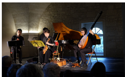
Château de la Bourdaisière, Montlouis sur Loire, 20 mai 2022 Le Concert des Oiseaux