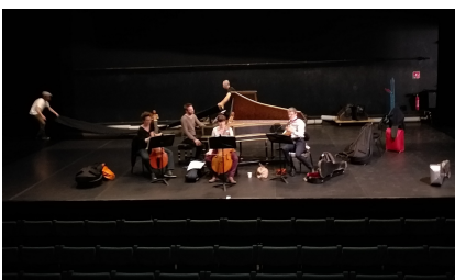
Scène nationale d'Orléans, 10 mai 2022 Fête Champêtre