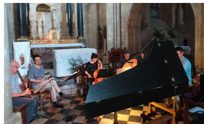
Eglise de Saint-Jean-de-Braye, 27-30 juin 2022 Enregistrement du Concert des Oiseaux