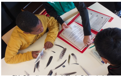
Cités Educatives, visite du Musée Orléanais de la Biodiversité et de l'Environnement, 31 mai et 2 juin 2022