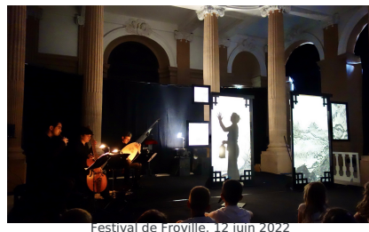
Festival de Frouville, 12 juin 2022 Le Rossignol et l'Empereur de Chine