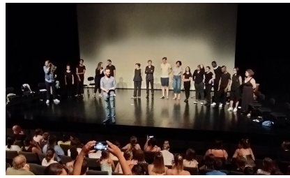
Théâtre d'Orléans, 18 juin 2022 Une école des Femmes - d'après Molière projet avec des jeunes de l'UEAJ, mené en collaboration avec le théâtre de l'éventail