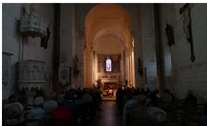
La Chatre, 25 juin 2022, Le Concert des Oiseaux