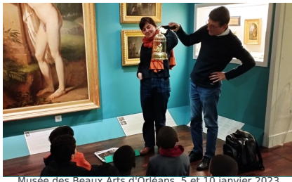
Musée des Beaux Arts d'Orléans, 5 et 10 janvier 2023 Visite autour du Carnaval des animaux en péril , dans le cadre des Cités Educatives