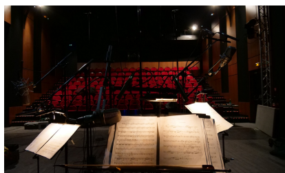
Théâtre du Puits-Manu, Beaugency, 13-14 janvier 2023 Enregistrement Le Rossignol et l'Empereur de Chine