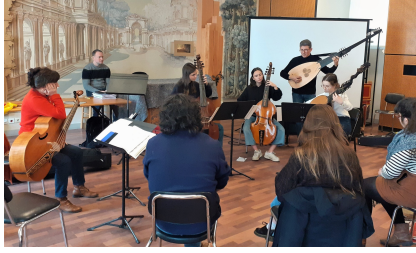
Centre de musique baroque de Versailles, 25 février 2023 Master Class et Journée d'étude sur Caix d'Hervelois