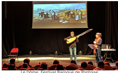
Le Dôme, Festival Baroque de Pontoise 9 et 10 février 2023 Interventions scolaires autour du Carnaval des animaux en péril