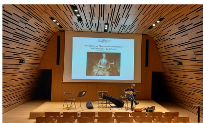
Château de Versailles, 24 janvier 2023 Le Salon de musique de Mme de Pompadour