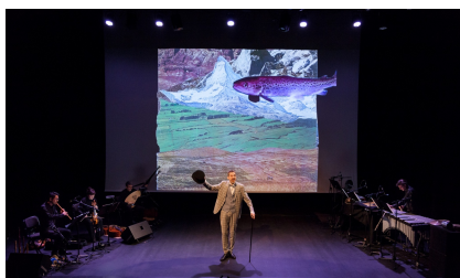
Scène Nationale d'Orléans, 1er février 2023 Carnaval des animaux en péril