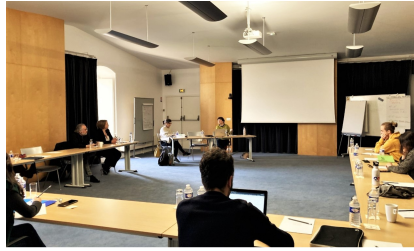
Abbaye de Royaumont, 28 février 2023 Intervention de La Rêveuse dans une formation sur les conceptions de projets à géométrie variable