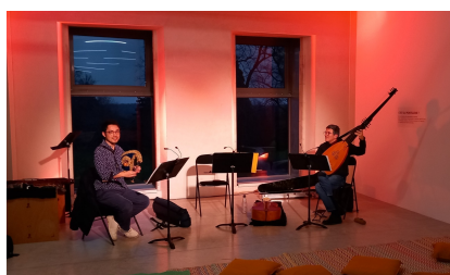
Parc Culturel de Rentilly, Festival Frisson Baroque, 28-29 janvier 2023 Le Concert des Oiseaux